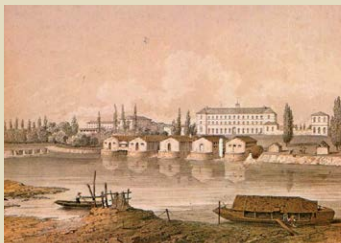
Premiers bâtiments, peu de temps après la création de la Manu.

Retrouvez en ligne la brochure Laissez-vous conter La Manufacture d'Armes de Châtellerauld sur www.tourisme-chatellerauld.fr