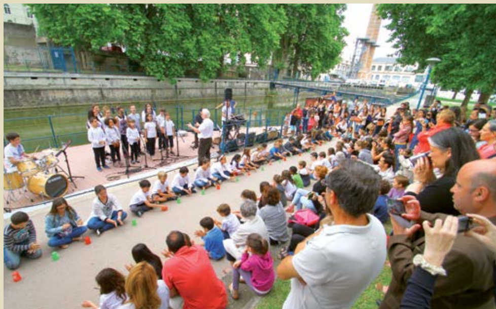
Cup song aux abords du canal par les élèves du Conservatoire l'été dernier

De nombreux travaux sont nécessaires d'ici 2019 pour mieux organiser le site :