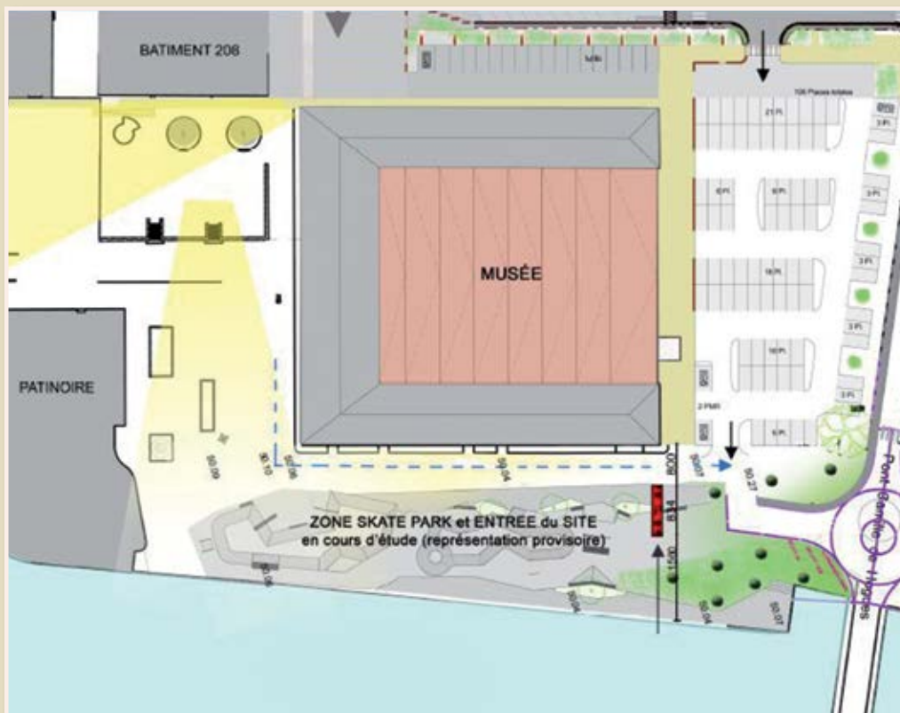
Document de travail provisoire sur le projet global de réhabilitation en cours

La création de cette structure béton représente un coût global de 400 000 € pour la Ville, et de 175 000 € pour l'Agglo (aménagement des espaces élargis en prolongement du skatepark). La maîtrise d'œuvre a été attribuée au cabinet Fest Architecture-Constructo Skatepark, spécialisé internationalement dans ce domaine : les travaux débiteront dès le mois de février pour être terminés au début de l'été !