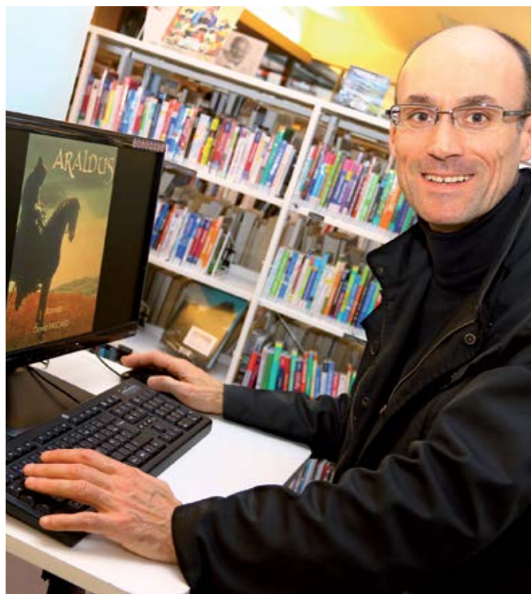
Araldus eBook, Amazon Kindle et Kobo Fnac, 3,99€ Éditions Jerkbook Jean-François Pissard

*CRAC : Châtelleraut Rugby Athlétique Club