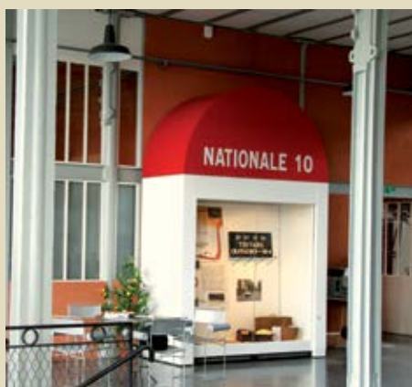
Chaque année, un thème original vous permet de découvrir un aspect de l'histoire des transports terrestres lors d'une exposition temporaire : L'exposition Nationale 10 se prolongera en 2016...

Retrouvez en ligne la brochure Laissez-vous conter La Manufacture d'Armes de Châtellerauld sur www.tourisme-chatellerauld.fr