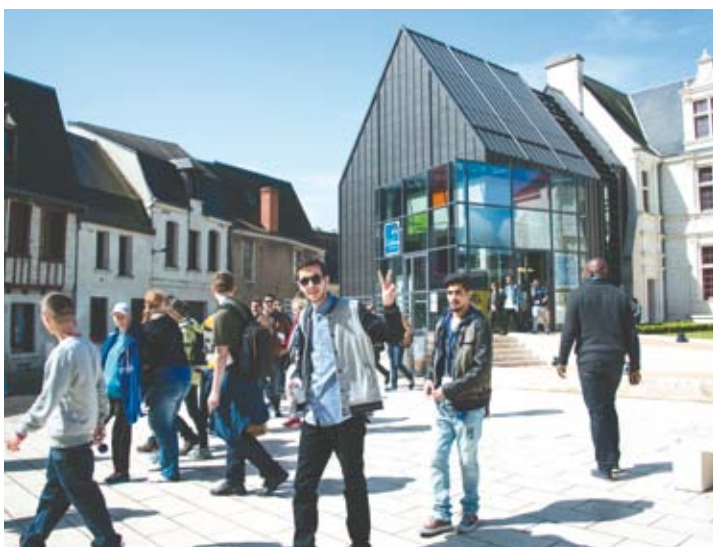
Jeunes allemands de Velbert à la découverte de Châtelleraut, lors des journées de Fo(u)r Europe en mai dernier.

Ce temps d'échanges, de réflexion et de travail qui s'est notamment déroulé à Châtelleraut en mai dernier, a aussi été l'occasion de célébrer officiellement les 50 ans de jumelage entre les villes de Velbert et de Châtelleraut !