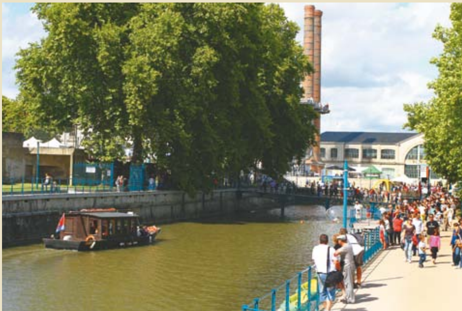
La Ville a doré et déjà voté l'aménagement d'un nouveau skatepark à la Manu, pour un coût opérationnel de 400 000 euros. Lors du dernier conseil communautaire, une autorisation de programme, crédits de paiement (Ap/Cp) a été votée afin de financer à hauteur de 3,9 millions d'euros une opération d'aménagement du site. Visant à la construction d'une identité spécifique à la Manu, il consiste en la réalisation d'ouvrages de surface pour en accroître l'attractivité, en corollaire d'activités nouvelles comme la batellerie. Objectif principal : être prêts pour l'anniversaire des 200 ans de la Manu qui seront célébrés en 2019 !

« À 4 millions d'euros, comme on nous le proposait il y a encore un an, certainement pas. À 1,18 million, c'est une vraie opportunité ! En n'achetant pas à ce prix là, on prenait le risque de voir un promoteur s'emparer du site pour développer un projet en parfaite inadéquation avec les besoins de notre ville, ou bien que personne ne se porte acquéreur et que ces 3,8 hectares ne se transforment en quelques années en une gigantesque friche au cœur de Châtellerauld. »