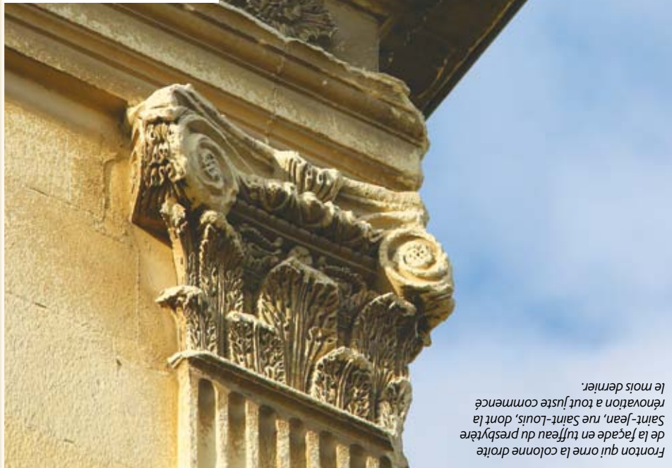
Fronton qui orne la colonne droite de la façade en tuffeau du presbytère Saint-Jean, rue Saint-Louis, dont la rénovation a tout juste commencé le mois dernier.