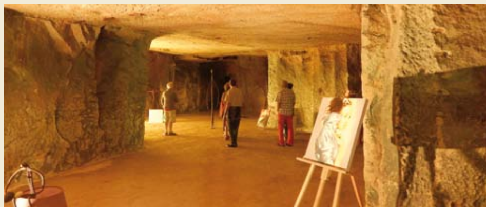
Des carrières du XVII e aux champignonnières du siècle dernier, les quelque 6 kilomètres de galeries permettent de se familiariser « à la source », avec le fragile tuffeau qui a permis de construire tant de maisons et de monuments châtelleraudais.

Une passionnante exposition-matériau-thèque raconte, en mots, en images et en matières, l'histoire des matériaux et de la construction en Pays Châtelleraudais.