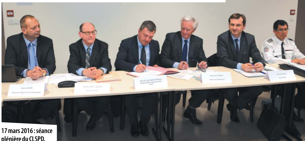
17 mars 2016 : séance plénière du CLSPD.

Des propositions et des projets concrets émergent régulièrement de ces rendez-vous. Lors du dernier CLSPD en mars dernier, l'annonce de la création d'un observatoire de la délinquance va permettre la mise en place d'un outil utile pour la lutte contre l'insécurité :