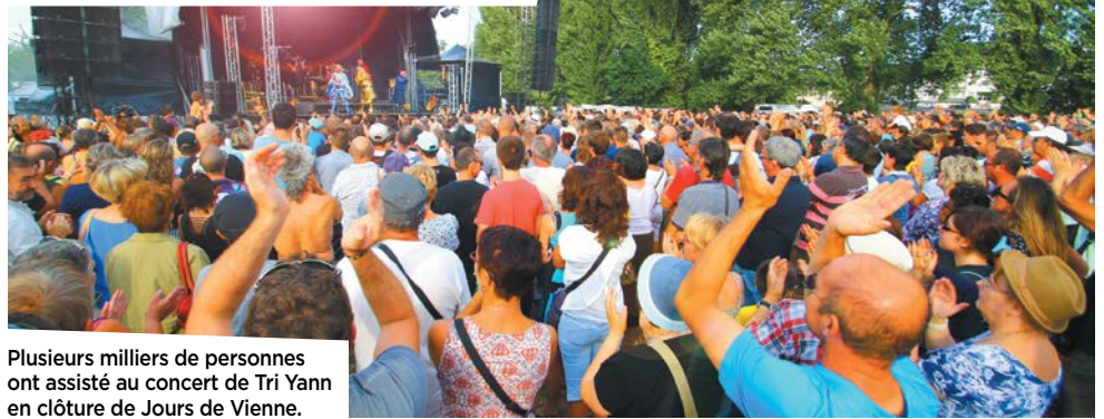
Plusieurs milliers de personnes ont assisté au concert de Tri Yann en clôture de Jours de Vienne.

Les deux rendez-vous de Jours de Vienne ont notamment fait carton plein. « La notoriété de l'événement s'étend d'année en année. La grande proximité entre les visiteurs, les exposants et les marinières est une des clés du succès. C'est vraiment un moment de divertissement pour tous, dont les retombées économiques sont importantes. » Parmi les best of de l'été 2016, les activités en eaux vives (promenade en canoë, paddle...) ont été plébiscitées. Les visites nocturnes organisées