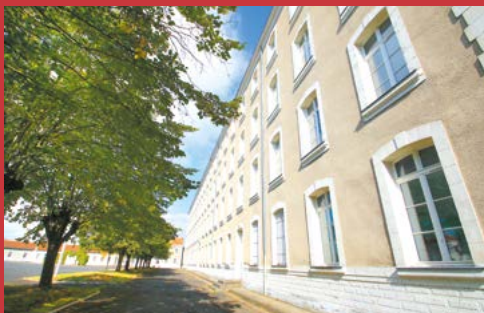
En 2015, la réflexion sur la reconversion s'engage, associant nombre d'acteurs et en particulier les habitants.

Dès 2015, la Ville a associé les habitants au projet de reconversion de l'îlot de Laâge afin d'élaborer un scénario en adéquation avec leurs besoins. Une consultation publique a permis d'esquisser les grandes lignes d'une reconversion « idéale ». Parmi 14 propositions, l'installation d'un commissariat et de logements sont celles qui ont remporté le plus de voix. L'implantation du chapiteau de l'école de cirque fin 2017 signe l'amorce de la reconquête du site par les habitants.