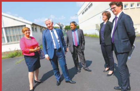
En 2016, pour 1,18 million d'€, l'Établissement Public Foncier Nouvelle-Aquitaine rachète le site à l'État pour le compte de la Ville. L'EPF en assure la sécurisation et la démolition partielle.