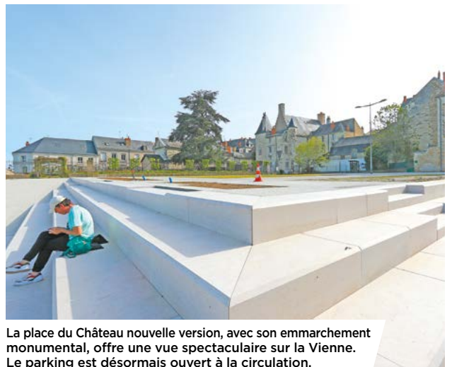
La place du Château nouvelle version, avec son embarquement monumental, offre une vue spectaculaire sur la Vienne. Le parking est désormais ouvert à la circulation.

Bimensuel d'informations de la Ville de Châtelleraudais - Hôtel de ville - BP 619 - 78, boulevard Blossac 86106 Châtelleraudais Cedex - Courriel : le-chatelleraudais@ville-chatelleraudais.fr