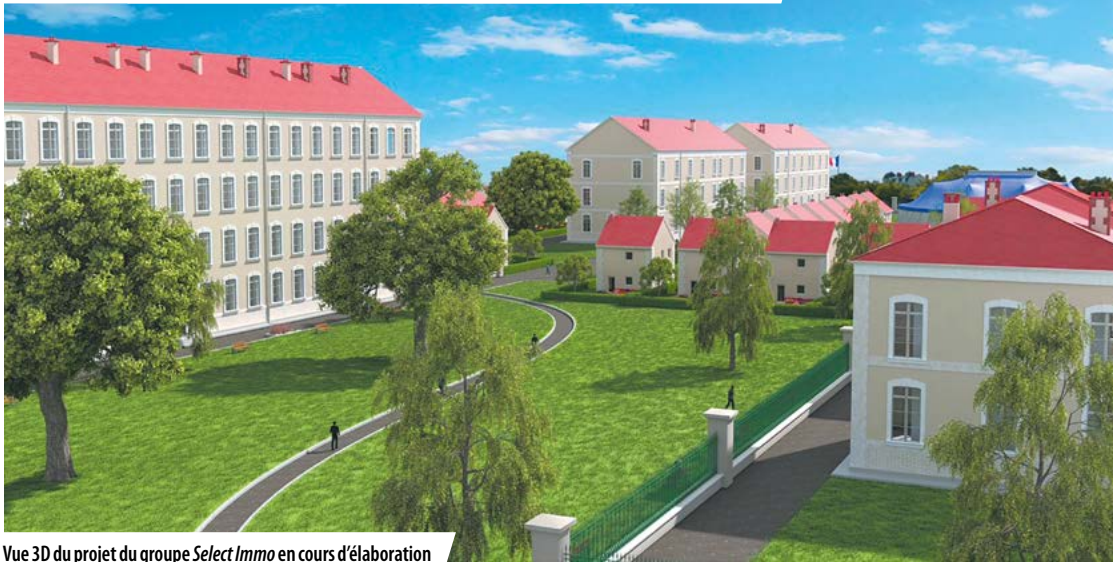
Vue 3D du projet du groupe Select Immo en cours d'élaboration