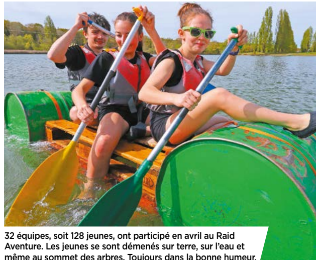
32 équipes, soit 128 jeunes, ont participé en avril au Raid Aventure. Les jeunes se sont démenés sur terre, sur l'eau et même au sommet des arbres. Toujours dans la bonne humeur.