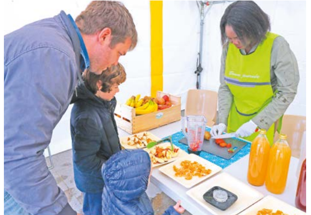
L'événement C'est ma santé invitait les Châtelleraudais, venus en nombre, à prendre soin d'eux. Au menu ? Des dépistages gratuits, des ateliers santé, des dégustations pour apprendre à équilibrer son alimentation.

Maire de Châtelleraudais, Président de Grand Châtelleraudais