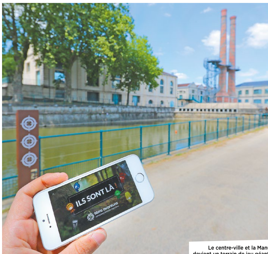
Le centre-ville et la Manu devient un terrain de jeu géant.