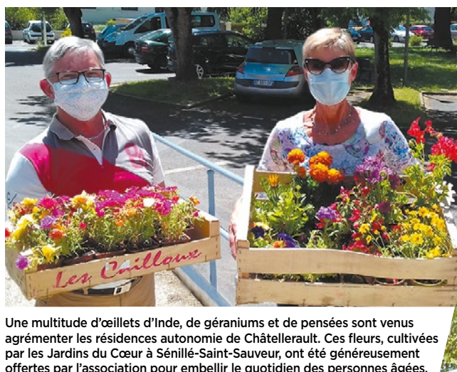
Une multitude d'œillettes d'Inde, de géraniums et de pensées sont venus agrémenter les résidences autonomie de Châtellerauld. Ces fleurs, cultivées par les Jardins du Cœur à Sennillé-Saint-Sauveur, ont été généreusement offertes par l'association pour embellir le quotidien des personnes âgées.

Bimensuel d'informations de la Ville de Châtellerauld - Hôtel de ville - BP 619 - 78, boulevard Blossac 86106 Châtellerauld Cedex - Courriel : le-chatelleraudais@ville-chatellerauld.fr