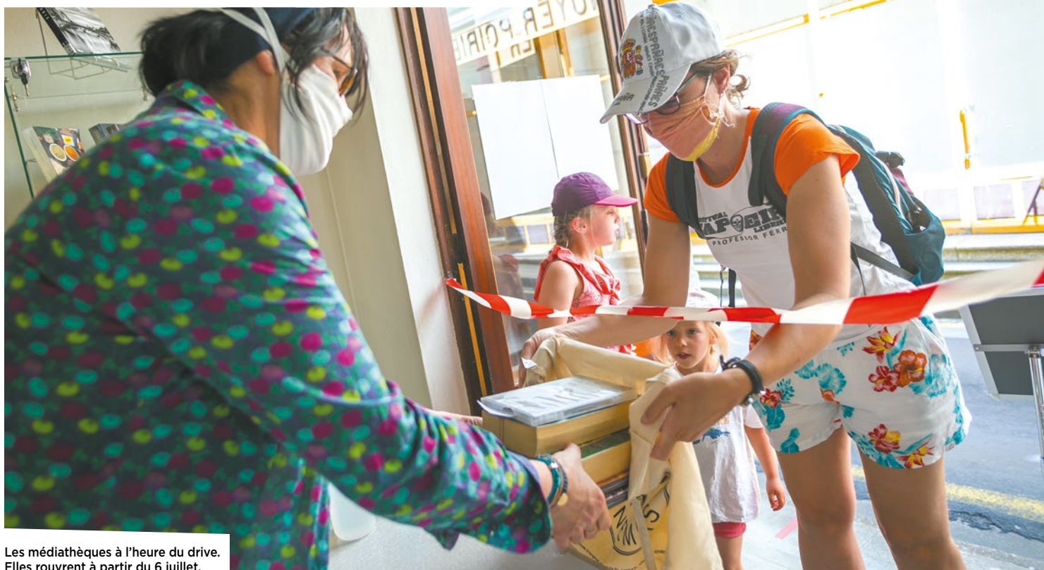
Les médiathèques à l'heure du drive. Elles rouvrent à partir du 6 juillet.