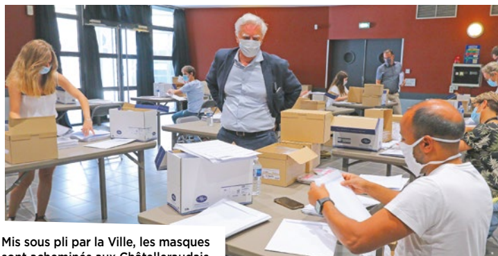
Mis sous pli par la Ville, les masques sont acheminés aux Châtelleraudais.

L'usine Aigle d'Ingrandes-sur-Vienne s'est également lancée dans la fabrication de masques en tissu pour participer à la lutte contre la pandémie. 800 ont été offerts à la Ville de Châtellerauld. La générosité du groupe s'est également exprimée par des dons de masques au bénéfice des soignants et de plusieurs communes environnantes.