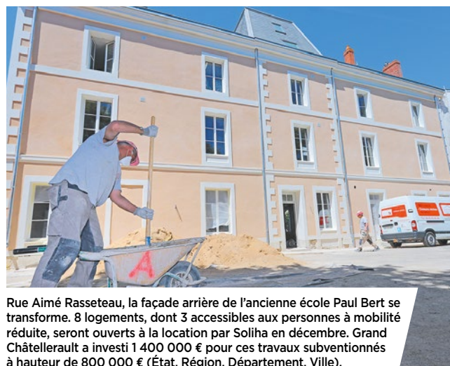
Rue Aimé Raseteau, la façade arrière de l'ancienne école Paul Bert se transforme. 8 logements, dont 3 accessibles aux personnes à mobilité réduite, seront ouverts à la location par Soliha en décembre. Grand Châtellerauld a investi 1 400 000 € pour ces travaux subventionnés à hauteur de 800 000 € (État, Région, Département, Ville).