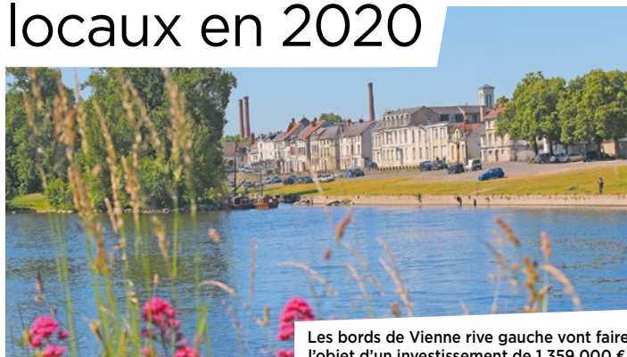
Les bords de Vienne rive gauche vont faire l'objet d'un investissement de 1 359 000 €.

La crise sanitaire, qui touche notre pays, a bouleversé la vie de chacun et bien évidemment celle de notre collectivité.