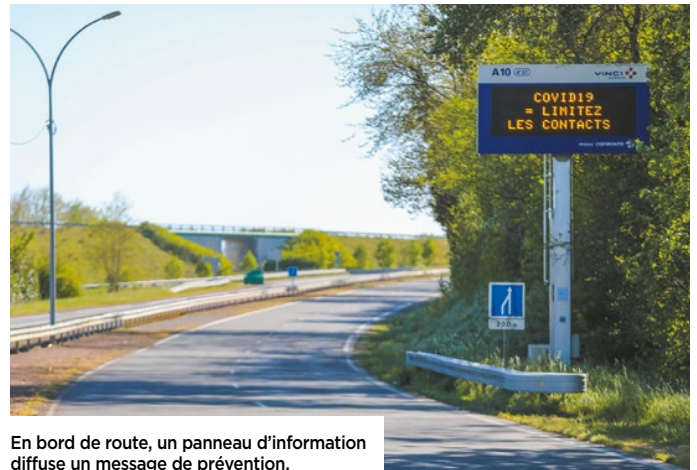
En bord de route, un panneau d'information diffuse un message de prévention.