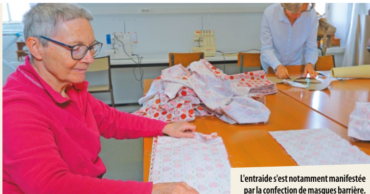
L'entraide s'est notamment manifestée par la confection de masques barrière.