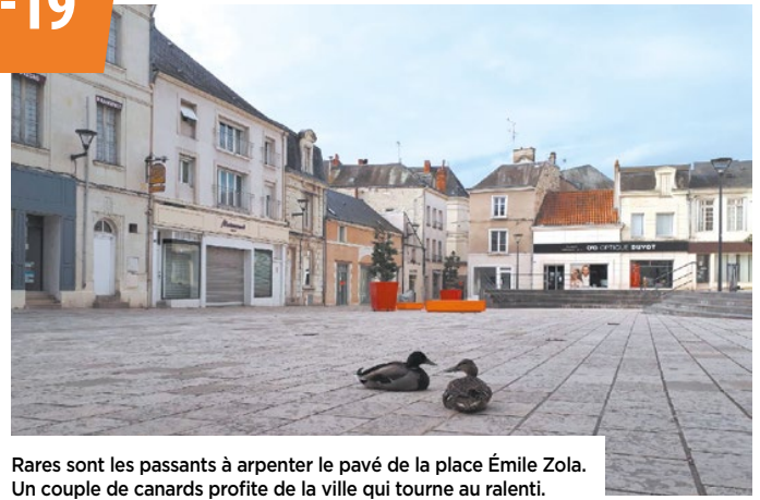
Rares sont les passants à arpenter le pavé de la place Émile Zola. Un couple de canards profite de la ville qui tourne au ralenti.