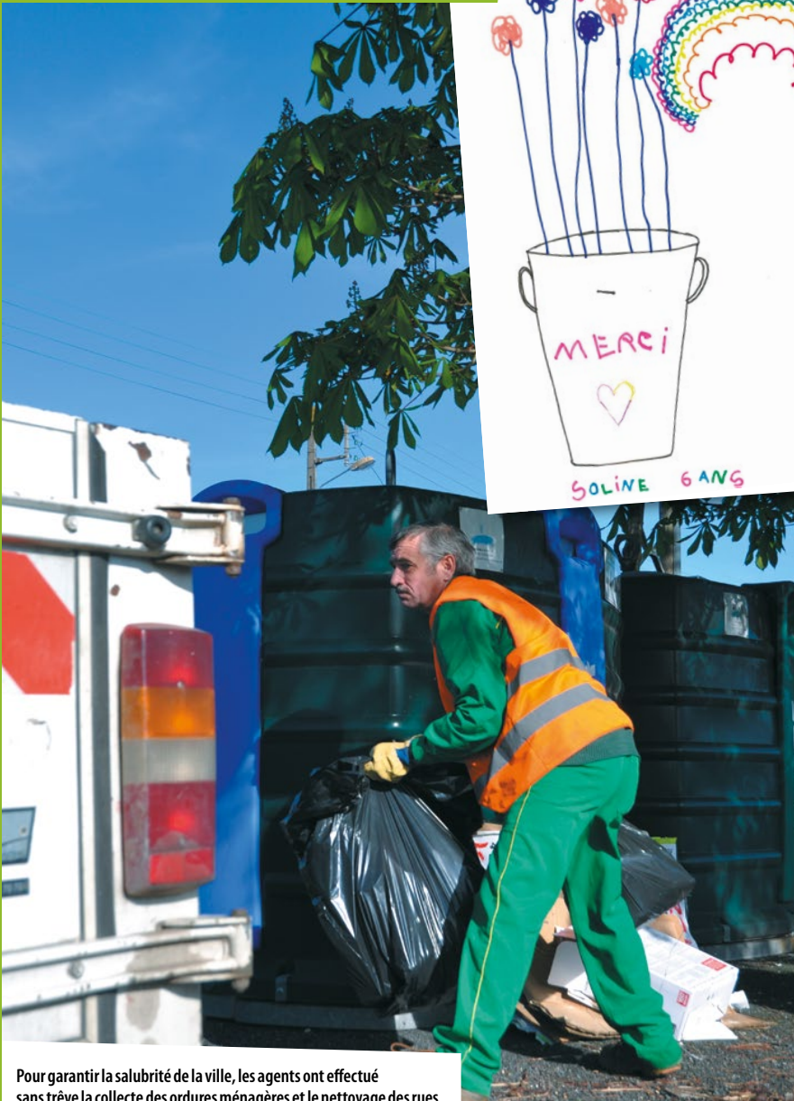
Pour garantir la salubrité de la ville, les agents ont effectué sans trêve la collecte des ordures ménagères et le nettoyage des rues.