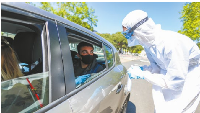
Boulevard Blossac, un drive-test est mis en place par Bio 86 avec l'appui logistique de la Ville. Les personnes munies d'une prescription médicale peuvent, en restant dans leur véhicule, être prélevées pour un dépistage du Covid-19.