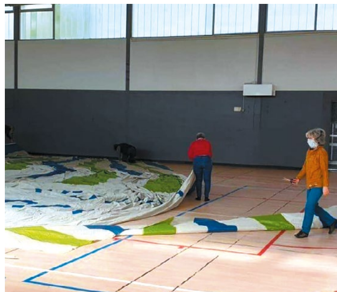
L'entreprise Montgolfière Centre Atlantique a fait don de deux toiles de montgolfière. Les couturières de la MPT les découpent dans un équipement sportif de la Ville. Objectif : réaliser des sur-blouses.

L'un des défis de la Ville a été de coordonner toutes les bonnes volontés au regard des besoins. L'appel à la solidarité lancé a été largement entendu. Un nombre considérable de personnes se sont manifestées pour prêter main forte.