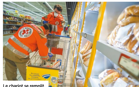
Le chariot se remplit.