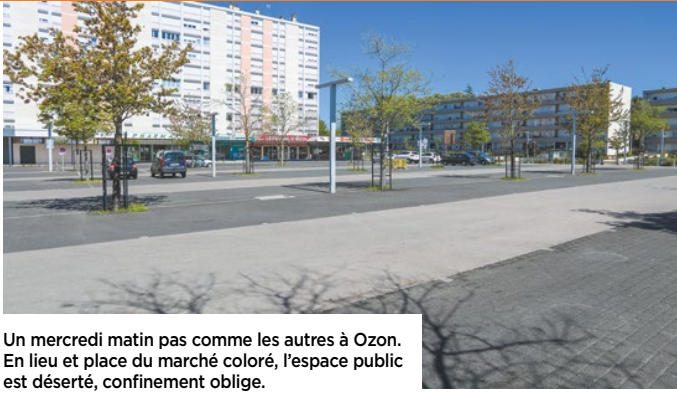
Un mercredi matin pas comme les autres à Ozon. En lieu et place du marché coloré, l'espace public est déserté, confinement oblige.