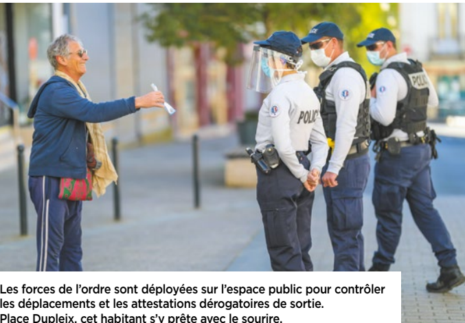
Les forces de l'ordre sont déployées sur l'espace public pour contrôler les déplacements et les attestations dérogatoires de sortie. Place Duplex, cet habitant s'y prête avec le sourire.