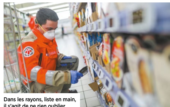
Dans les rayons, liste en main, il s'agit de ne rien oublier.