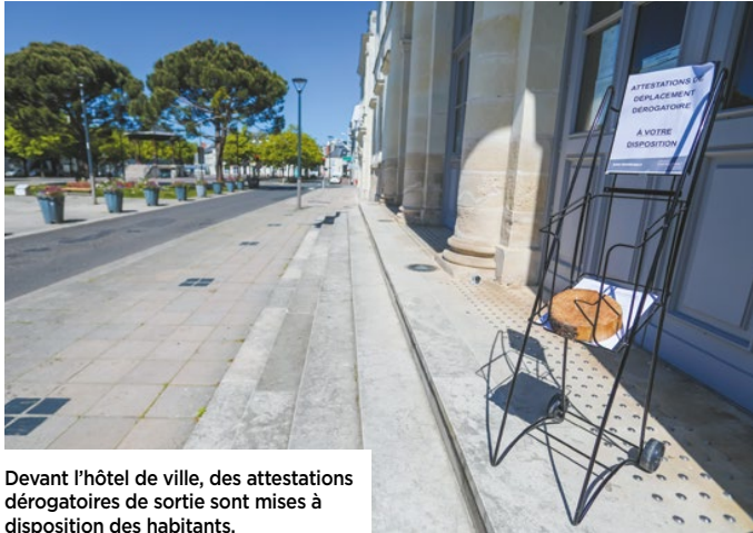
Devant l'hôtel de ville, des attestations dérogatoires de sortie sont mises à disposition des habitants.