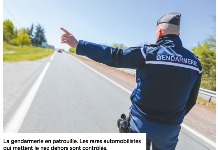
La gendarmerie en patrouille. Les rares automobilistes qui mettent le nez dehors sont contrôlés.