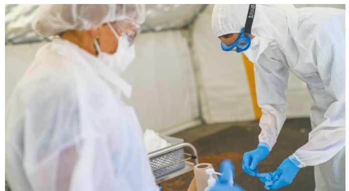
Les équipes de biologistes du drive-test suivent un protocole drastique d'hygiène. Pour effectuer ces prélèvements et éviter au maximum les risques de contamination, ils sont équipés comme s'ils se rendaient dans un bloc opératoire.