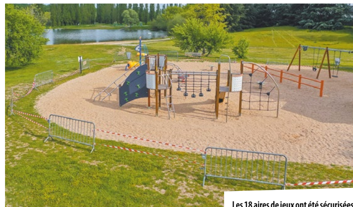
Les 18 aires de jeux ont été sécurisées.

Durant le confinement, la Ville a continué à faire fonctionner les services publics de base, en maintenant notamment la propreté urbaine, l'état civil, les services de santé et de sécurité. Face à la hauteur des événements, les agents ont fait preuve de professionnalisme, et trouvé des solutions inédites aux nombreux problèmes rencontrés par les habitants. Les collectivités territoriales sont inscrites en première ligne dans cette parenthèse de l'Histoire qui marquera chacun d'entre nous à vie.