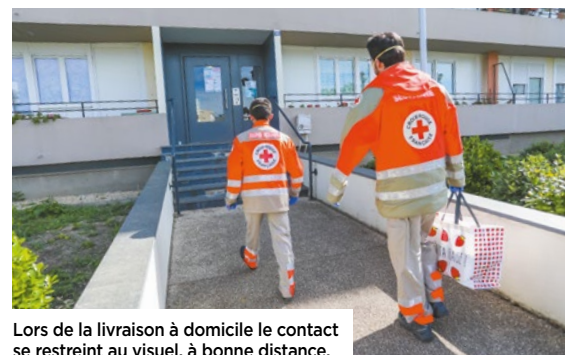
Lors de la livraison à domicile le contact se restreint au visuel, à bonne distance.