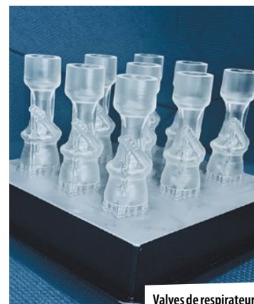
Valves de respirateurs

Sollicitée par la direction Recherche Clinique et de l'Innovation du CHU de Bordeaux, l'entreprise tente de mettre au point un nouveau type de valves destiné à être produites en grande série.