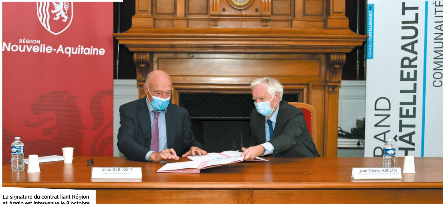
La signature du contrat liant Région et Agglo est intervenue le 8 octobre.