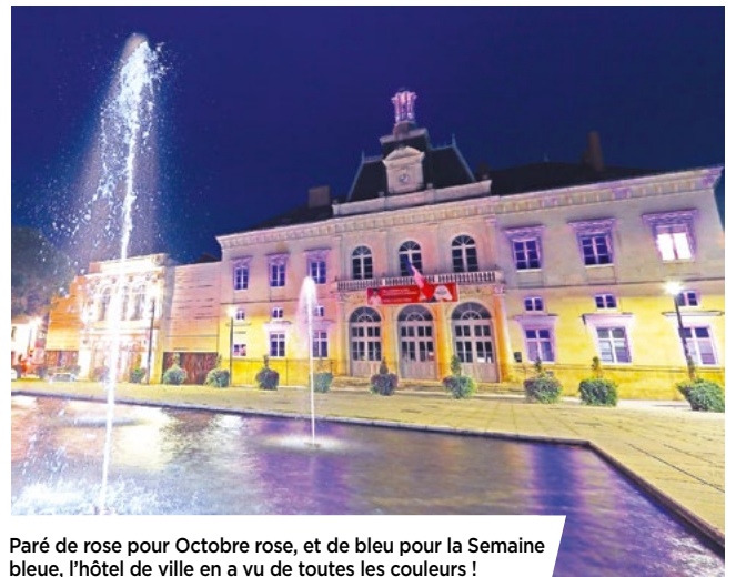
Paré de rose pour Octobre rose, et de bleu pour la Semaine bleue, l'hôtel de ville en a vu de toutes les couleurs !