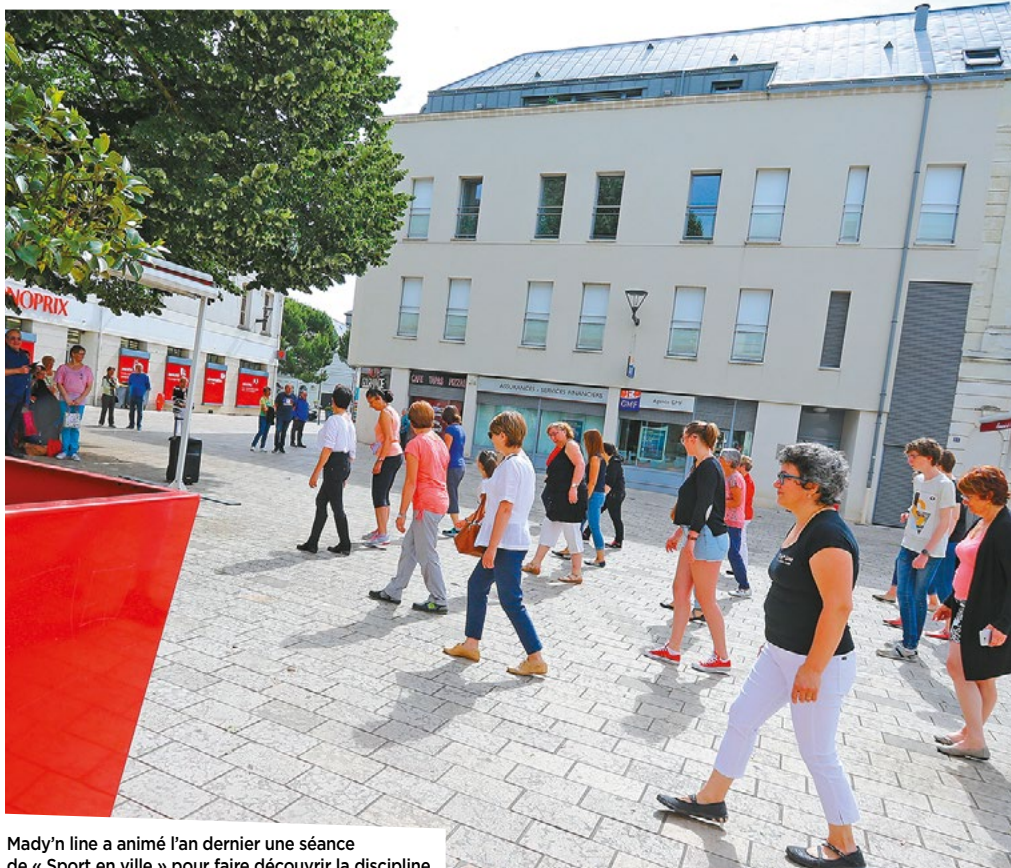
Mady'n line a animé l'an dernier une séance de « Sport en ville » pour faire découvrir la discipline.

Sa spécificité de se pratiquer sans contact est un atout que la Covid-19 a mis en exergue. La danse en ligne est accessible à tous et à n'importe quel âge. Elle est idéale pour exercer une activité physique dynamique au rythme de musiques entraînantes. Elle permet d'évacuer le stress, de refaire le plein d'énergie et de partager un moment agréable entre amis dans une ambiance conviviale et chaleureuse.