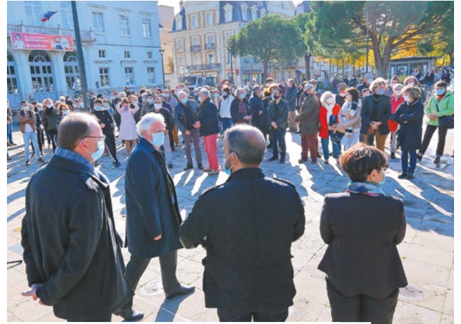
La Ville de Châtelleraudais s'est associée à l'hommage national à Samuel Paty, enseignant victime du terrorisme, le 21 octobre.

Maire de Châtelleraudais, Président de Grand Châtelleraudais