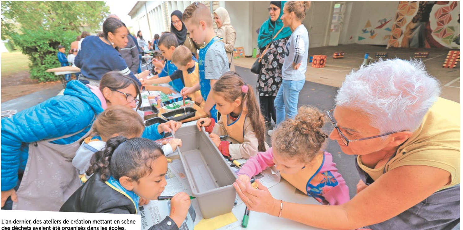
L'an dernier, des ateliers de création mettant en scène des déchets avaient été organisés dans les écoles.

La Semaine européenne de réduction des déchets se déroule du 21 au 28 novembre. Confinement oblige, les ateliers et les visites pour apprendre à jeter moins sont annulés. Pour autant, voici un fourmillement d'idées pratiques pour vivre mieux et plus sainement.