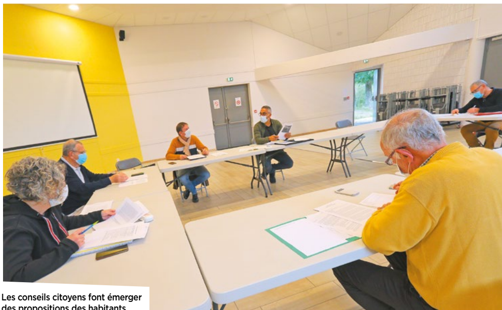
Les conseils citoyens font émerger des propositions des habitants.

Les conseils citoyens sont force de proposition en ce qui concerne les chantiers en cours dans leur quartier ou les préoccupations du quotidien. Ils sont composés d'habitants volontaires pour améliorer la vie de leur quartier, et par effet ricochet, de leur ville.