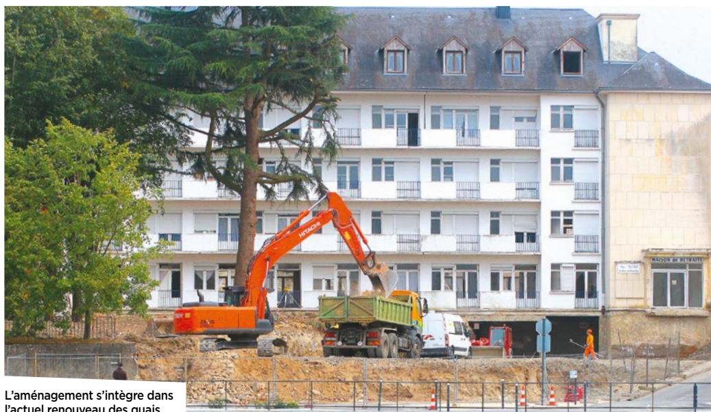
L'aménagement s'intègre dans l'actuel renouvellement des quais.

Après la réalisation de fouilles archéologiques préventives, les travaux de la future résidence seniors rue du Collège ont démarré début octobre. Ils sont menés par le promoteur privé Acapace.