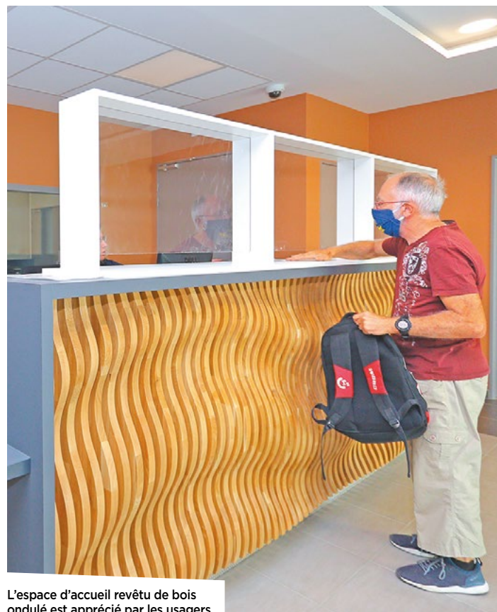
L'espace d'accueil revêtu de bois ondulé est apprécié par les usagers.