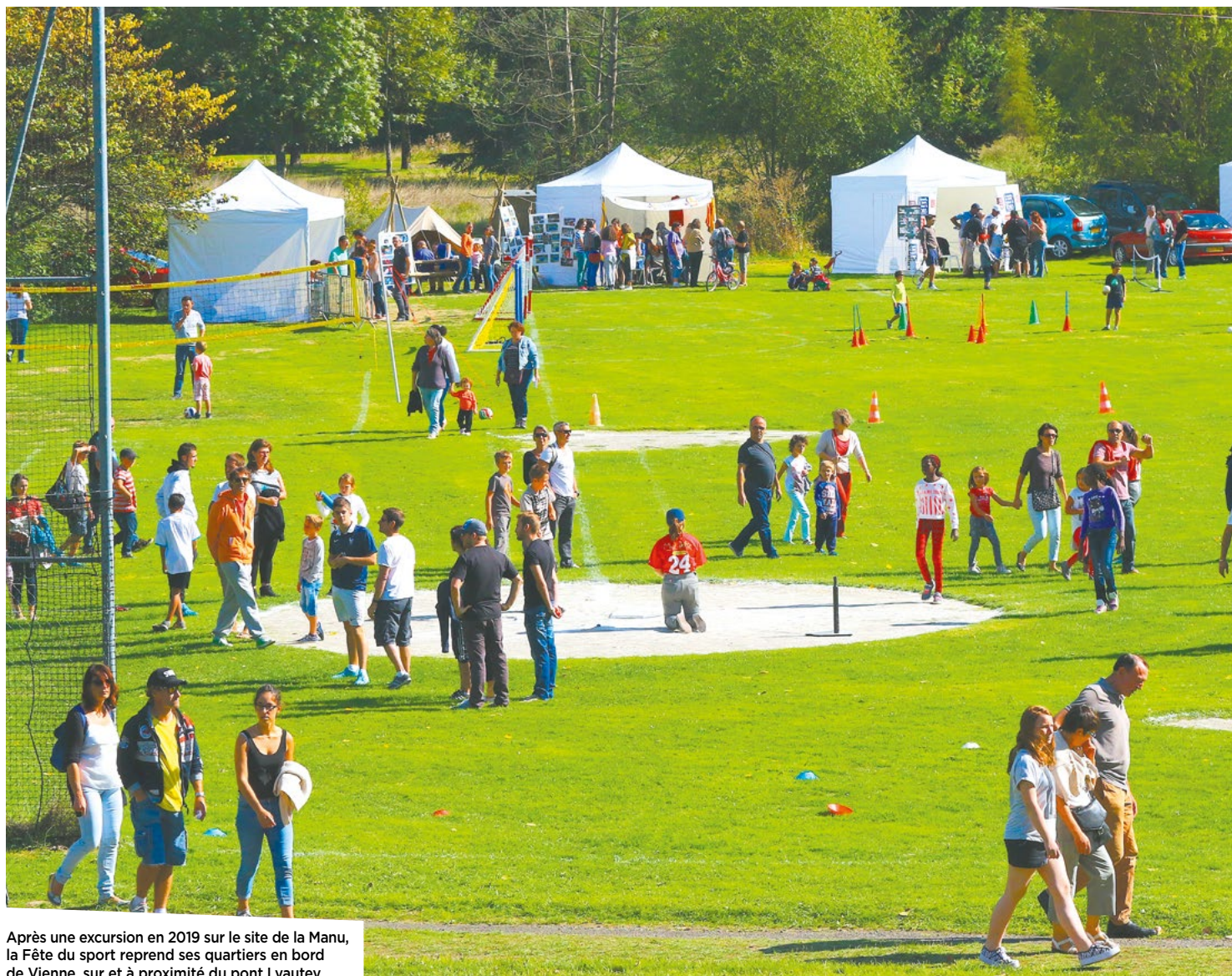
Après une excursion en 2019 sur le site de la Manu, la Fête du sport reprend ses quartiers en bord de Vienne, sur et à proximité du pont Lyautey.

Dimanche 6 septembre de 10h30 à 18h, les bords de Vienne sont le terrain de jeu de la Fête du sport. Au programme : démonstrations et initiations d'aviron, de golf, de paintball mais aussi de hockey sur glace ou encore de judo, de basket-ball ou de bridge. De La Nautique à la Plaine Baden-Powell en passant par la Gornière et le pont