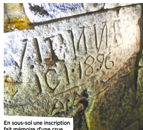
En sous-sol une inscription fait mémoire d'une crue.