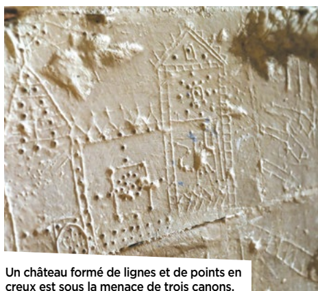
Un château formé de lignes et de points en creux est sous la menace de trois canons.