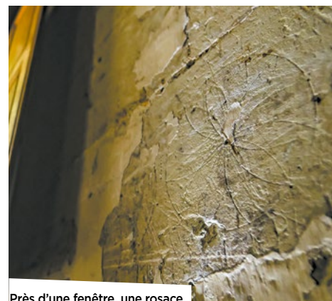
Près d'une fenêtre, une rosace.