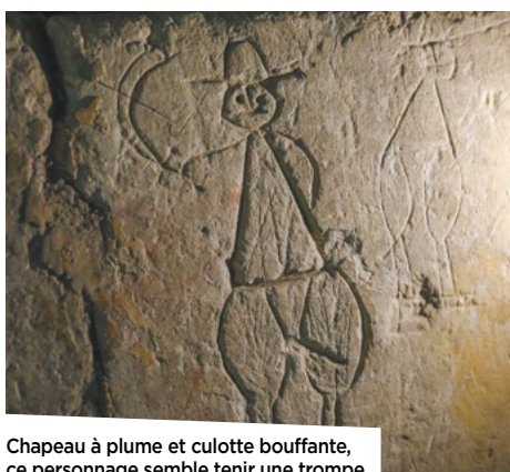
Chapeau à plume et culotte bouffante, ce personnage semble tenir une trompe.