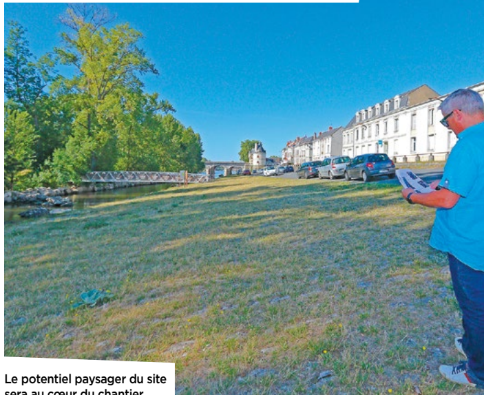
Le potentiel paysager du site sera au cœur du chantier.

Le montage du projet des Bords de Vienne rive gauche emboîte le pas à la métamorphose des quais rive droite. Fin juillet, le maître d'œuvre a été désigné à l'issue d'un appel d'offres. Il s'agit de l'agence Phytolab qui a notamment réalisé des aménagements à Port Boinot (Niort), Cœur de Maine (Angers) ou à Saint-Nazaire. L'opération châtelleraudaise consiste à sublimer le cachet végétal de l'espace allant du Pré de l'Assesseur au pont Henri IV, soit une emprise de 28 400 m 2 . En adéquation avec les vœux des habitants exprimés lors de la concertation préalable, le projet doit composer avec les contraintes environnementales, patrimoniales et l'inondabilité du site. Julien Perrin, responsable du service maîtrise d'ouvrage urbaine, indique : « La rive droite est conçue comme un balcon d'où l'on jouit de l'amplitude de la rivière. La rive gauche est à imaginer comme une mise en scène végétale, un poumon vert où les usages spontanés, les évènements festifs auront leur place ».