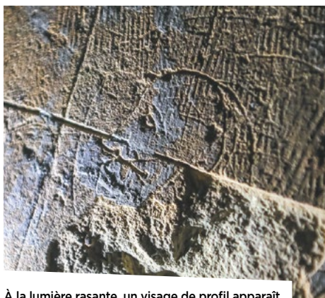
À la lumière rasante, un visage de profil apparaît.