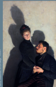
© Émile Friant, Ombres portées, huile sur toile, Paris Musée d'Orsay, 1891

L'ombre est un élément pictural, un signe plastique utilisé en peinture et repéré par Plinthe l'Ancien à l'origine. La photographie fera l'écho de cet artifice jusqu'à nos jours. Daniel Clauzier retrace les grands moments lumineux de cette histoire.