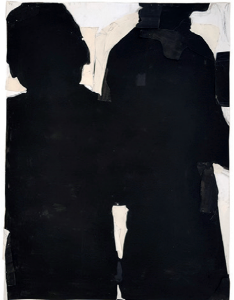
© Jean-Charles Blais, sans titre, gouache sur papier, 106x81 cm, 2015, Paris