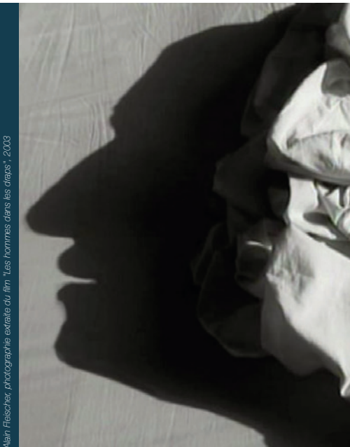
© Alain Fleischer, photographie extraite du film "Les hommes dans les draps", 2003

Écrivain récompensé par le Goncourt des lycéens, cinéaste reconnu par ses pères comme Jean-Luc Godard, photographe et créateur de l'école studio d'art contemporain du Fresnoy. Alain Fleischer a de multiples talents. Découvrez Les hommes dans les draps , un glissement magique où l'ombre des visages apparaît fugitive et sans bruit comme un mirage.