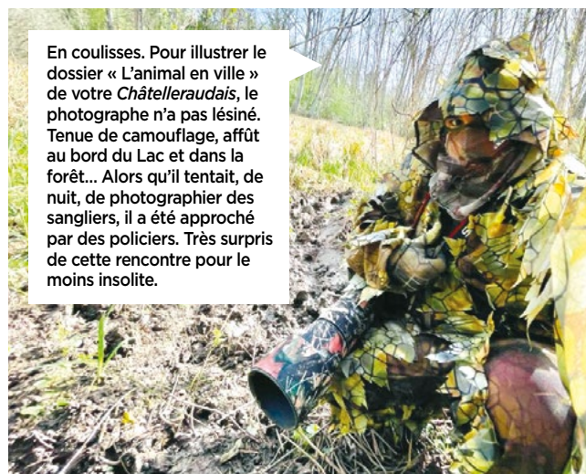
En coulisses. Pour illustrer le dossier « L'animal en ville » de votre Châtelleraudais , le photographe n'a pas lésiné. Tenue de camouflage, affût au bord du Lac et dans la forêt... Alors qu'il tentait, de nuit, de photographier des sangliers, il a été approché par des policiers. Très surpris de cette rencontre pour le moins insolite.

Bimensuel d'informations de la Ville de Châtellerauld - Hôtel de ville - BP 619 - 78, boulevard Blossac 86106 Châtellerauld Cedex - Courriel : le-chatelleraudais@ville-chatellerauld.fr