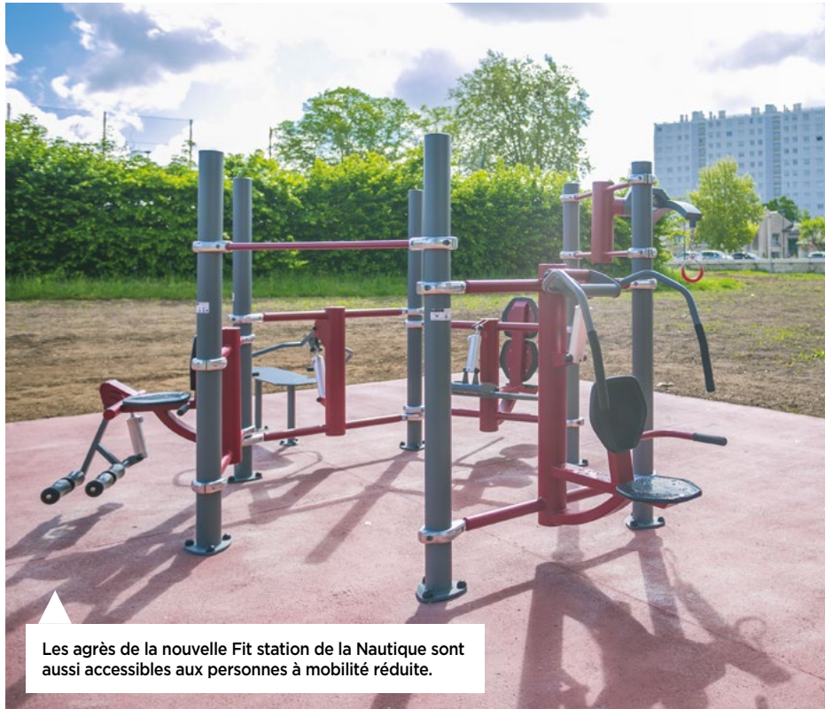
Les agrès de la nouvelle Fit station de la Nautique sont aussi accessibles aux personnes à mobilité réduite.

L'objectif de ce fitness, dont l'engouement vient d'Outre-Atlantique, est de se maintenir en bonne santé, se faire plaisir et développer sa musculation. Du sport en liberté, « gratuit et ouvert à tous à partir de 14 ans, sans oublier les personnes à mobilité réduite, grâce au choix qui a été fait d'installer des agrès accessibles » mentionne Harbi Bouhassoun, chargé de projet dans le cadre de la gestion urbaine de proximité. Il s'agit d'exercices de « poussée du poids », qu'on module grâce à des vérins sécurisés offrant plusieurs niveaux de difficulté. À proximité, les agrès existants de street workout, sont basés sur l'utilisation du poids du corps. « Ce nouvel équipement est donc complémentaire, ce qui va répondre à la demande des nombreux utilisateurs du site » ajoute le chargé de projet. Fitness, basket 3x3, parcours santé, aviron, tennis, balade au bord de l'eau : la Nautique affirme sa vocation de réunir les Châtelleraudais autour du sport et de la détente.