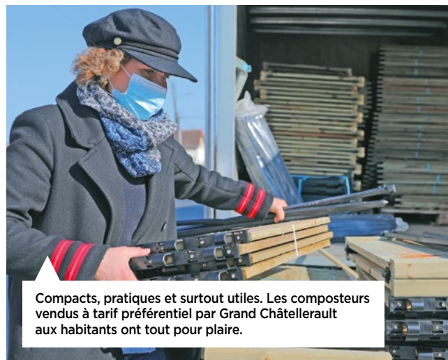
Compacts, pratiques et surtout utiles. Les composteurs vendus à tarif préférentiel par Grand Châtellerauld aux habitants ont tout pour plaire.

Maire de Châtellerauld, Président de Grand Châtellerauld