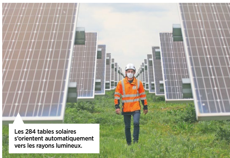
Les 284 tables solaires s'orientent automatiquement vers les rayons lumineux.

Vous avez peut-être déjà vu briller ces grands panneaux argentés au lieu-dit la Massonne, au nord de la ville. Inauguré en 2019, ce parc photovoltaïque de 4,5 hectares est installé sur un ancien centre d'enfouissement de déchets. Il fournit de l'électricité à partir du soleil. C'est la première centrale photovoltaïque de Grand Châtellerauld à être équipée d'un système de tracker solaire permettant aux panneaux fabriqués par VMH Énergies de pivoter pour suivre le soleil. D'après Sergies, propriétaire de l'installation, le site a produit 3 648 000 kWh en 2020, soit l'équivalent de la consommation annuelle de 2 027 habitants, hors chauffage et eau chaude sanitaire. Un résultat conforme aux prévisions. Il permet d'économiser chaque année plus de 1 000 tonnes de CO 2 .