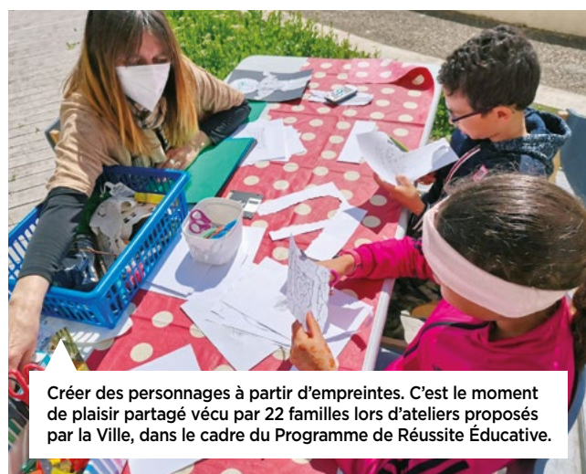
Créer des personnages à partir d'empreintes. C'est le moment de plaisir partagé vécu par 22 familles lors d'ateliers proposés par la Ville, dans le cadre du Programme de Réussite Éducative.