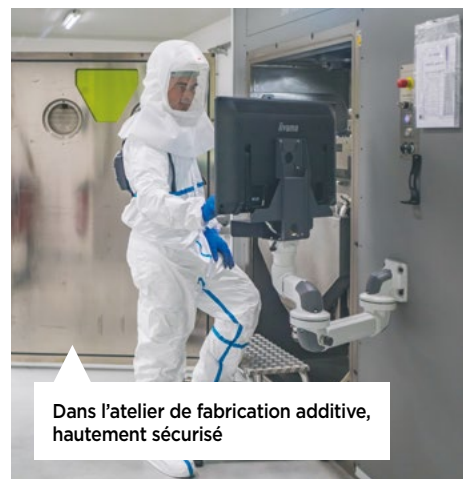
Dans l'atelier de fabrication additive, hautement sécurisé